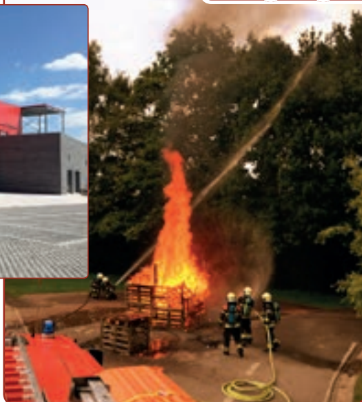
De nieuwe brandweerpost aan de Brusselsesteenweg zal begin september worden ingehuldigd.