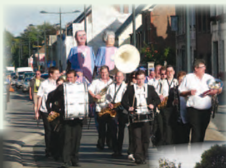
◀ Melse feesten