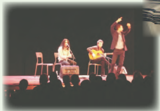
◀ Oorkussen in Studio M