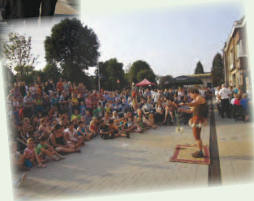
Vlaamse feestdag ▶ op 11 juli