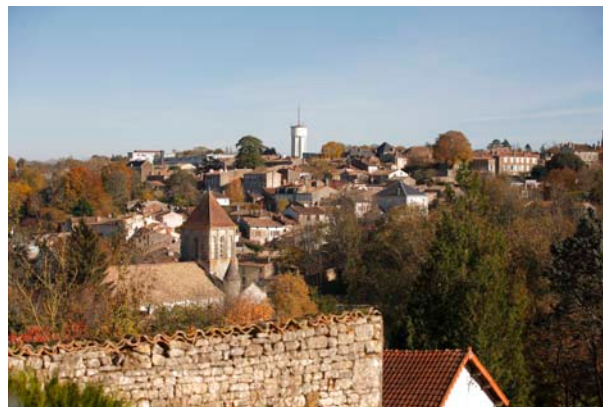
Zicht op Melle, met op de voorgrond de kerk van Saint-Hilaire.