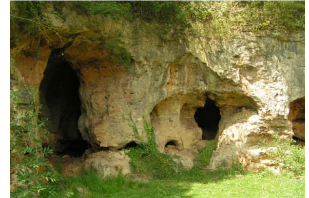
De vroegere zilvermijnen - buiten ↑ binnen ↓