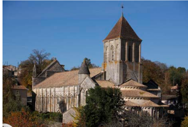
Kerk van Saint-Hilaire.